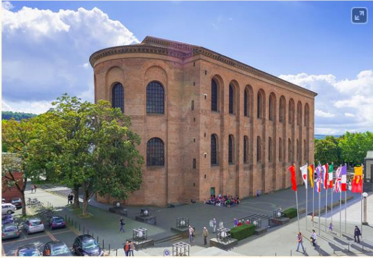
Basilika mit Konstantinsplatz 2014

Die Evangelische Kirche zum Erlöser (Konstantinbasilika) in der Stadt Trier (Augusta Treverorum) war ursprünglich eine römische Palastaula . Sie wurde als Audienzhalle der römischen Kaiser, die im 4. Jahrhundert in der Stadt residierten, erbaut. An diese Zeit und Zweckbestimmung erinnert nur noch die Nennung des Kaisers Konstantin in Konstantin-Basilika . Die Bezeichnung des Bauwerks als Basilika stammt vom Heimatforscher Johannes Steiner (19. Jahrhundert), der sie einer spätantiken Lobrede auf den Kaiser Konstantin entnahm. Sie ist aus heutiger Sicht unpassend, da sie