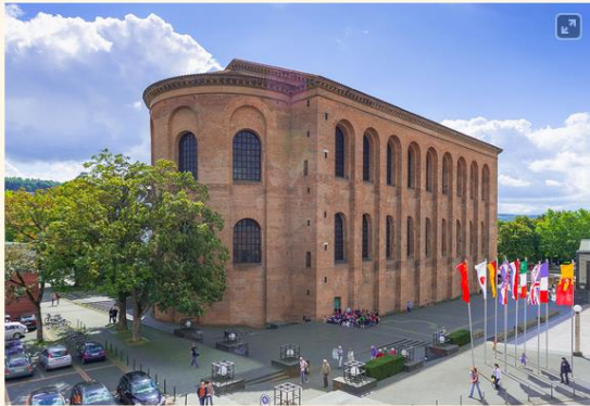
Basilika mit Konstantinsplatz 2014

Die Evangelische Kirche zum Erlöser (Konstantinbasilika) in der Stadt Trier (Augusta Treverorum) war ursprünglich eine römische Palastaula . Sie wurde als Audienzhalle der römischen Kaiser, die im 4. Jahrhundert in der Stadt residierten, erbaut. An diese Zeit und Zweckbestimmung erinnert nur noch die Nennung des Kaisers Konstantin in Konstantin-Basilika . Die Bezeichnung des Bauwerks als Basilika stammt vom Heimatforscher Johannes Steiner (19. Jahrhundert), der sie einer spätantiken Lobrede auf den Kaiser Konstantin entnahm. Sie ist aus heutiger Sicht unpassend, da sie