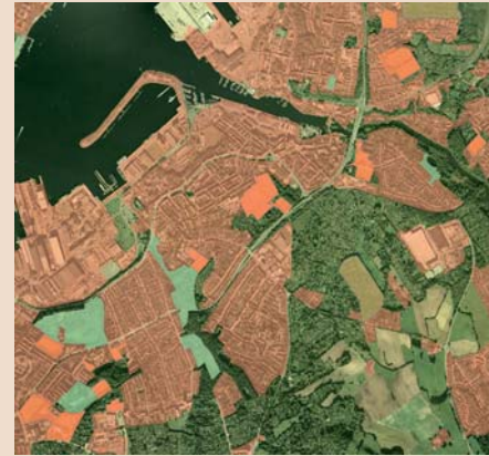
Heute: Die Entdeckung der Realität