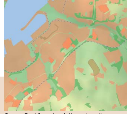
Gestern: Zweidimensionale Kartendarstellung

Die Earth Extension ist ein Produkt der infas GEOdaten GmbH. Die Luftbilder werden von der GeoContent GmbH bereitgestellt – GeoContent GmbH ist auch die Firma, die Google Earth und Google Maps mit Luftbildern bestückt. Gehostet werden die Daten als Service auf Servern der atla4 Geoinformatik AG. ArcGIS ImageServer kommt als GIS-Server-Software zum Einsatz.